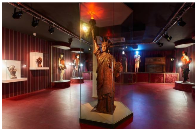
Musée du chocolat de Colmar