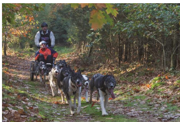
Balade en Chien de traineau